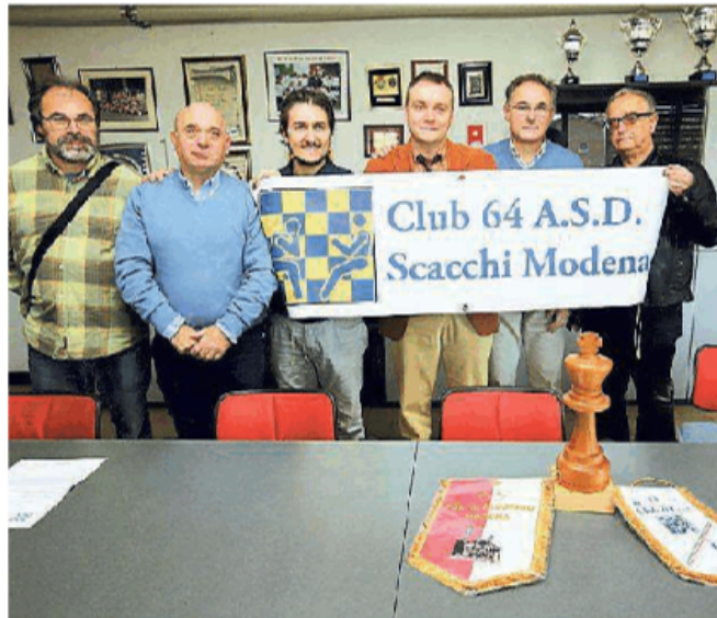
La squadra di scacchisti che nel 2015 ha rappresentato Modena agli Europei

«Sarebbe bello avere più attenzione, ma non posso lamentarmi. Intorno al Club 64